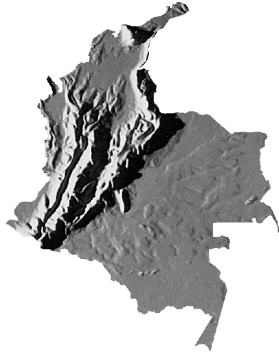
Figura 1: Mapa de sombra de las cordilleras de Colombia

Usted primero tiene que mirar los mapas antes de comenzar el análisis.